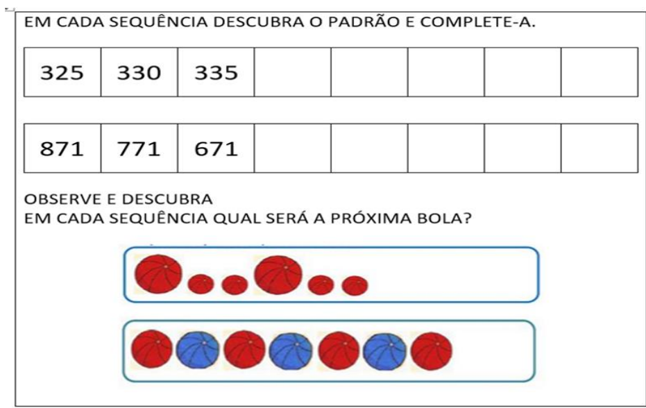
Figura 2. Tarefa presente no livro didático.

O enunciado da tarefa pede " observe e descubra, em cada sequência qual será a próxima bola ". Diante disso, o grupo discutiu fazendo algumas considerações sobre a figura apresentada no livro, no caso, uma sucessão de bolas utilizando padrões voltados para tamanho e cores e chegaram ao entendimento que, se o professor, neste nosso caso específico, a professora não dispôr de saberes acerca do pensamento algébrico, dificilmente conseguirá problematizar essa tarefa com os estudantes, fazer questionamentos, intervenções, utilizar materiais manipuláveis (tampinhas coloridas, palitos, lego, ou outros objetos) para que primeiramente eles possam criar sequências, manipular a ordem dos objetos, descobrir o segredo, conjecturar ideias, defender pontos de vista e argumentar, para depois, num segundo momento, realizar a tarefa proposta no livro didático.