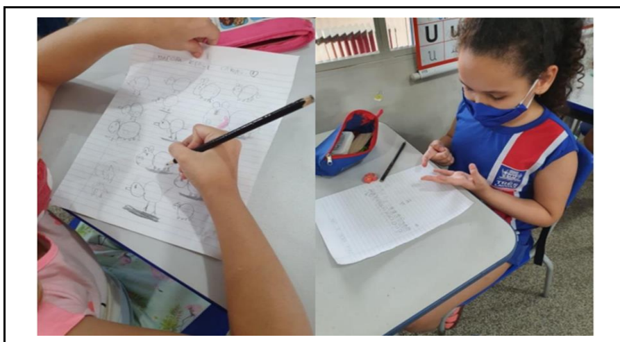
Figura 5. As crianças tentando resolver o problema.

Diferentes estratégias para a resolução desse mesmo problema foram criadas pelas professoras junto com seus estudantes. Enquanto as crianças do 1º ano foram para o chão da sala, desenharam e interpretaram o problema na busca de resolvê-lo de forma coletiva, em outras turmas, por exemplo no 2º ano, as crianças tentaram resolver de maneira individual, sentados com seus cadernos cada um em sua carteira, como pode ser visto na figura abaixo.