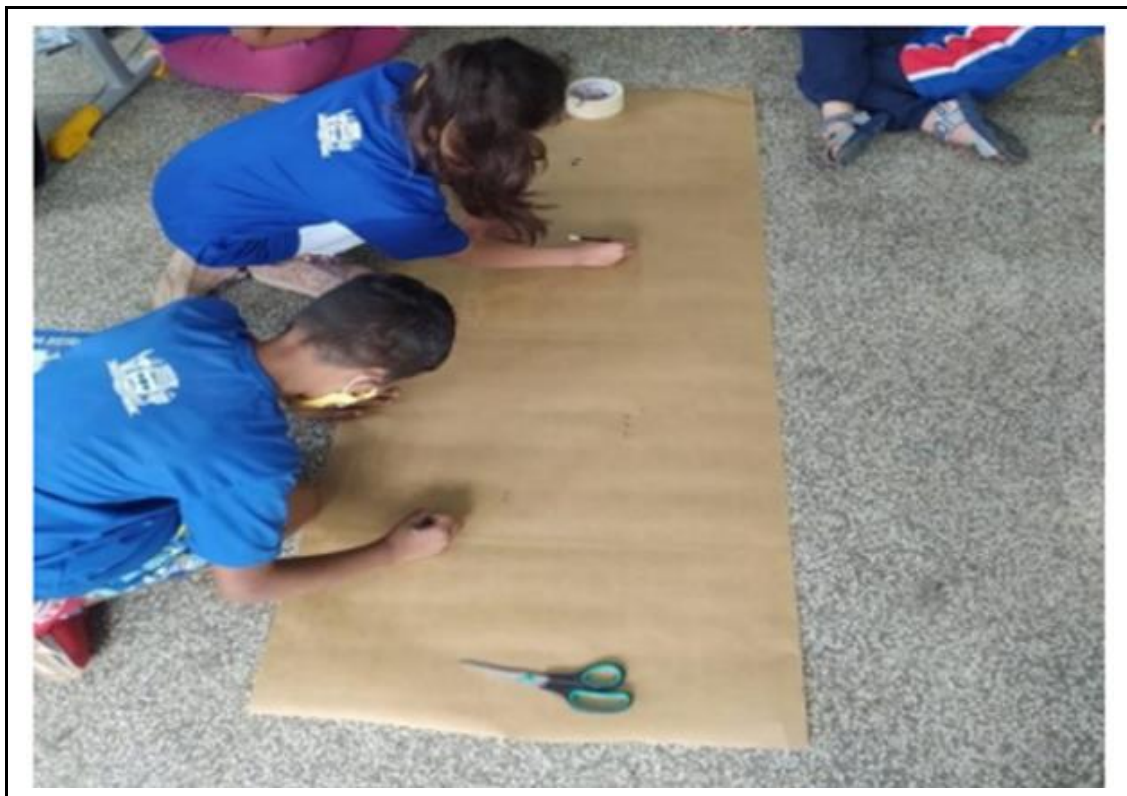
Figura 3. As crianças desenhando os animais e contando a quantidade de patas.